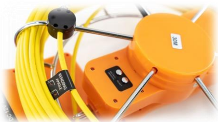
detail měřiče odvinu