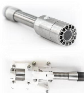
detail kamerové a naváděcí hlavy